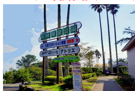
海の遊歩道、潮風を浴びて気持ちよく歩く