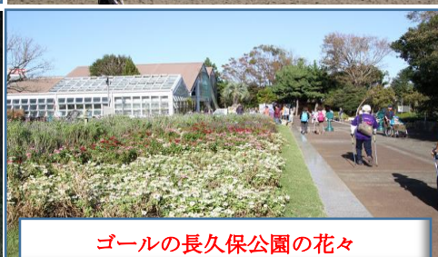
ゴールの長久保公園の花々