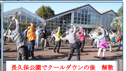
長久保公園でクールダウンの後 解散