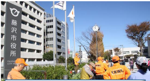
藤沢市役所広場でウォーミングアップ

2018(H30)年 10月 21日 (日曜日)9時30分～14時30分・距離:約8.3km・天候]晴天 微風 24℃ 晴天の下、雪景色の富士山が 参加者を迎えてくれました。 参加者:93名(内当日スタッフ9名) 市役所(ウォーミングアップ)～境川遊歩道～柏尾川との合流地点～藤沢の里山・新林公園(古民家見学) ～奥田橋～藤ヶ谷公園～江ノ電・鵠沼駅～賀来神社～鵠沼住宅地～鵠沼海岸公園(昼食)～ニエ・アル広 場～引地川遊歩道～鵠沼運動公園～引地川遊歩道～県立長久保公園(クールダウンの後 解散)