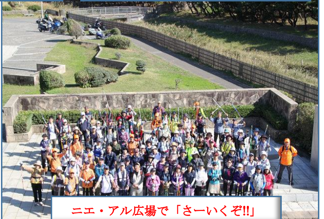
ニエ・アル広場で「さーいぞ!!」