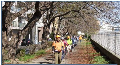
境川遊歩道ノルディックウォーキング