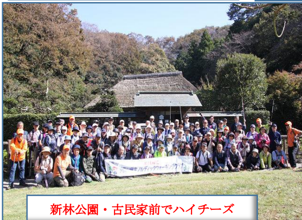
新林公園・古民家前でハイチーズ