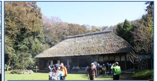
新林公園・古民家見学