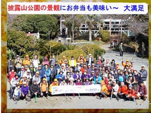
披露山公園の景観にお弁当も美味い～ 大満足