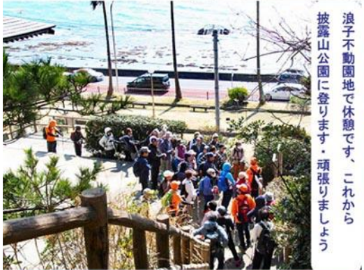
浪子不動園地で休憩です、これから披露山公園に登ります、頑張りますよう