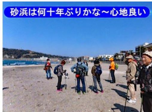
砂浜は何十年ぶりかな～心地良い