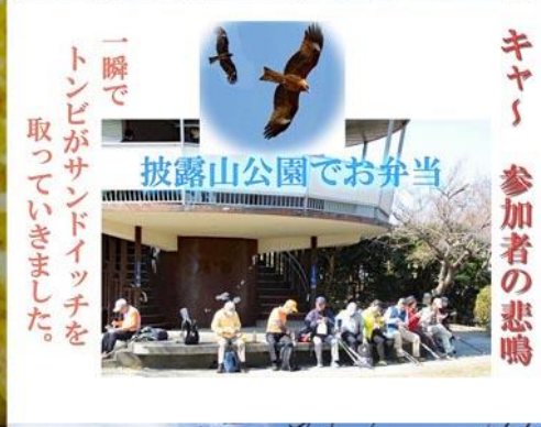
一瞬で トンビがサンドイッチを 取っていききました。