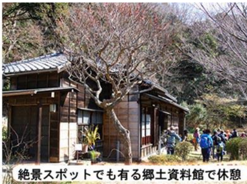
絶景スポットでも有る郷土資料館で休憩