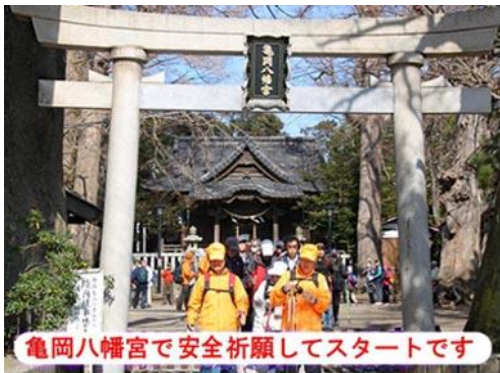
亀岡八幡宮で安全祈願してスタートです

◆JR 逗子駅～亀岡八幡宮(受付 WU)～逗子市郷土資料館～太陽の季節碑～浪子不動園地～披露山公園(昼食)～披露山庭園住宅 逗子マリーナ～和賀江島～内藤家墓所～光明寺(解散)～鎌倉駅で開催。晴天ながら風が強く、帽子を気にしながらのスタート、 逗子海岸には風を求める多くのウインドサーファーがカラフルなウインドサーフィンを気持ち良さそうに滑らせている景観に癒されました。 披露山高級住宅街の豪華さには感嘆。逗子、鎌倉の景観と歴史を楽しみながらのノルディックウォーキングに好評の声も多かった。