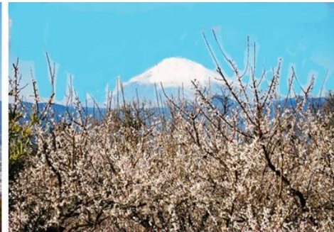
曾我梅林の白梅と富士山が綺麗です