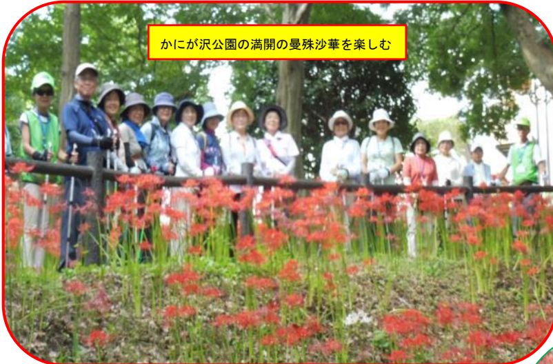
かにが沢公園の満開の曼珠沙華を楽しむ

年々本数が増えていて、真っ赤、ピンク、白色の3色が見事に咲き乱れていて、天候も爽やかな秋風に当たりながら、参加者一同感激しての行程でした。かにが沢までは谷戸山から往復約2.5kmなので、歩く距離がもの足らず、谷戸山に戻ってから木立の園内に入り木陰の遊歩道を約2kmくらい歩き、谷戸山残留組と合流しての解散でした。