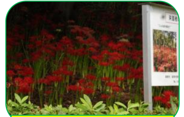
赤、ピンク、白の3色の曼珠沙華