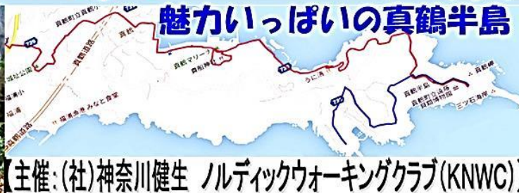
魅力いっぱいの真鶴半島