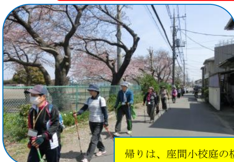
帰りは、座間小校庭の桜を眺めながら