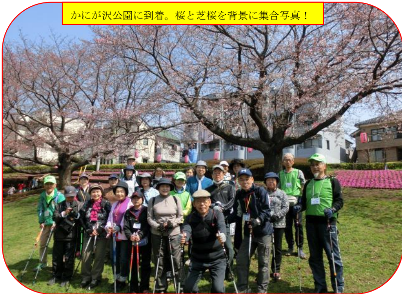
かにかが沢公園に到着。桜と芝桜を背景に集合写真！