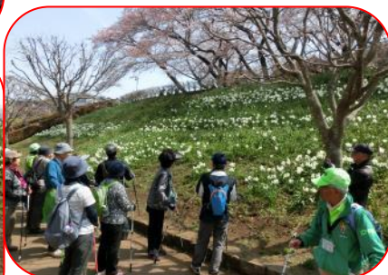
ZNW で植えた水仙も鑑賞できました