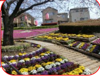
花を愛でながらの PW は快適そのもの！