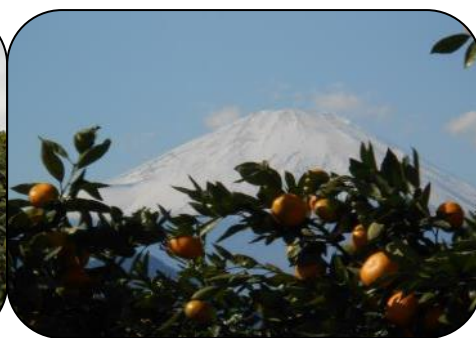
みかん園からの富士山(乞う、晴天)

・コース: 新松田駅(受付)～寒田神社(ウォーキングアップ)～酒匂川河原からアジサイ農道～瀬戸屋敷(自由見学)～新十文字橋～西平畑公園入口～松田山ハーブガーデン～吉田栄一みかん園(持参弁当昼食、みかん狩り)～松田山ハーブガーデン～河津桜径～JR 松田駅(解散予定:15時頃)(約11km)