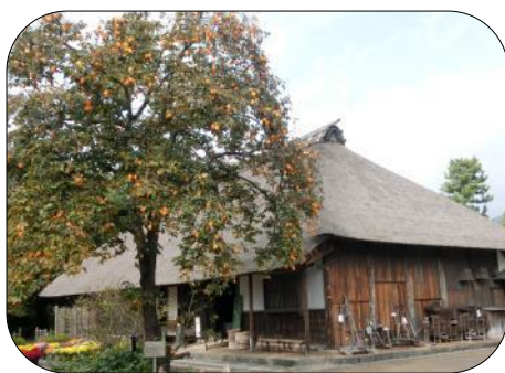
瀬戸屋敷の茅葺き寄棟造の主屋