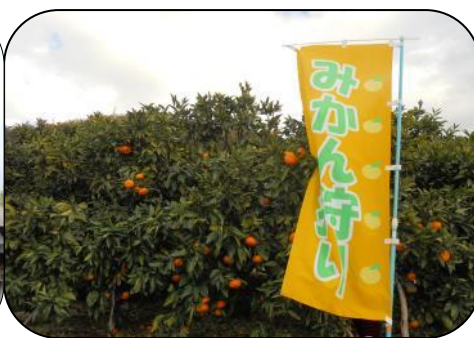
おなじみの青島は日持ちし美味しい